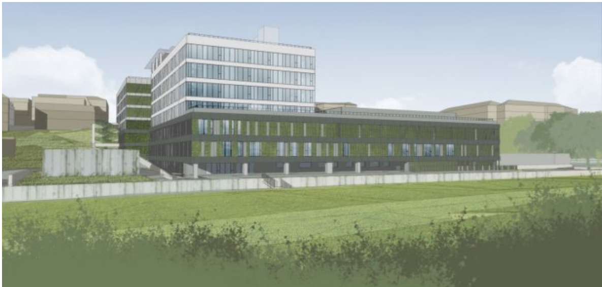
Wizualizacja od firmy Budimex SA