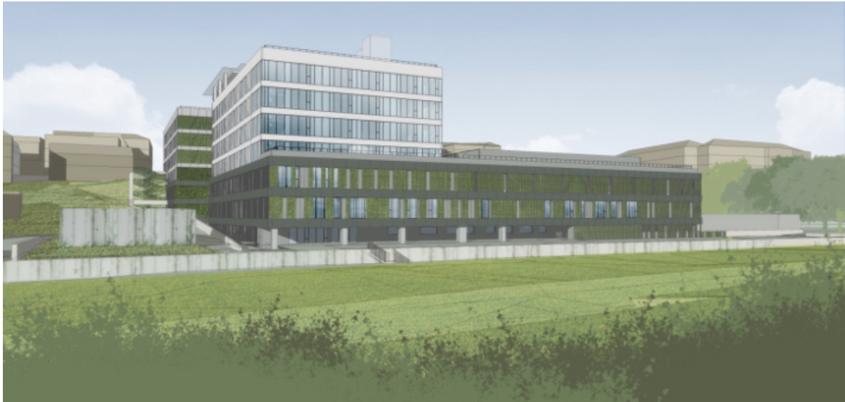
Rozbudowa Publicznego Szpitala Klinicznego nr 1 w Lublinie. Wizualizacja od firmy Budimex SA