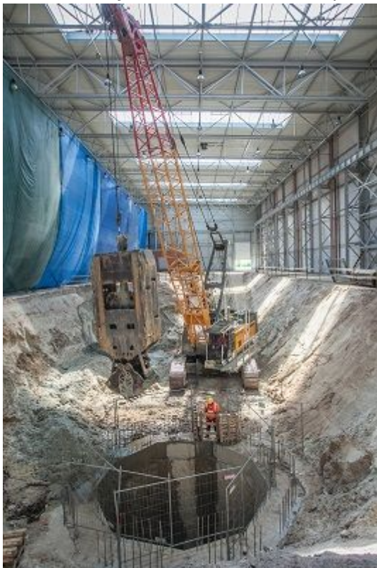
Wykonywanie ścian szczelinowych w szybie technologicznym.