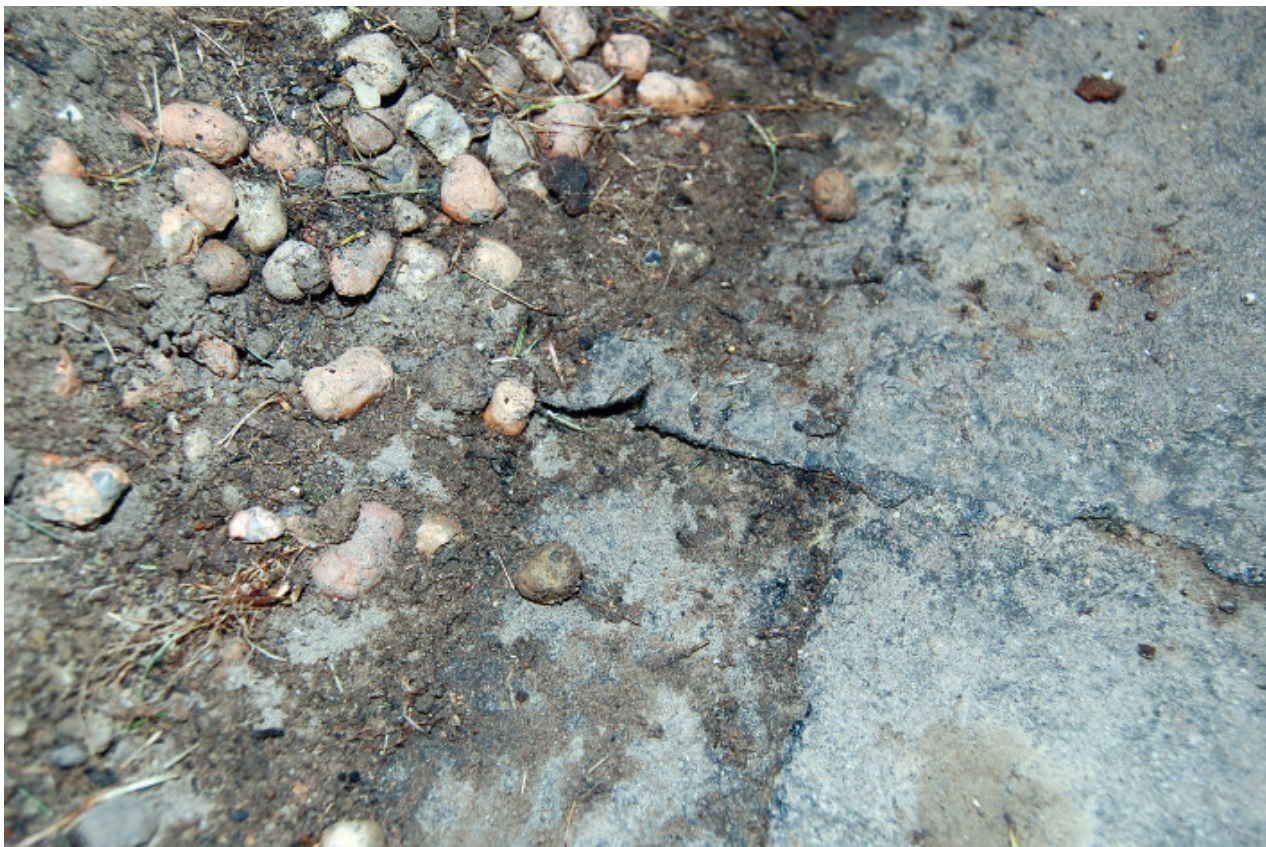
Fot. 1. Papa zdegradowana przez kwasy humusowe

Inną przyczyną przecieku może być uszkodzenie hydroizolacji przez korzenie roślin, niespotykane w innych zastosowaniach hydroizolacyjnych. Dach zielony z natury jest środowiskiem stworzonym do wzrostu i rozwoju korzeni roślin. Z tego powodu wszystkie materiały hydroizolacyjne stosowane na dachach zielonych muszą spełniać normę PN-EN 13948:2007, określającą odporność materiału hydroizolacyjnego i łącz na przebicie przez korzenie roślin. Nie jest to łatwe do osiągnięcia, ponieważ na przykład bitum, z którego zrobione są papy, nie jest szkodliwy dla korzeni roślin, co często można zaobserwować na starych dachach, na których z powodzeniem rośliny wrastają w papę. Aby tego uniknąć, materiały hydroizolacyjne muszą być łączone homogenicznie (na przykład metodą zgrzewania na gorąco folii PCV lub TPO) lub w strukturę materiału muszą być wbudowane środki odpychające korzenie (jak warstwa folii miedzianej lub herbicydy w papach termozgrzewalnych).