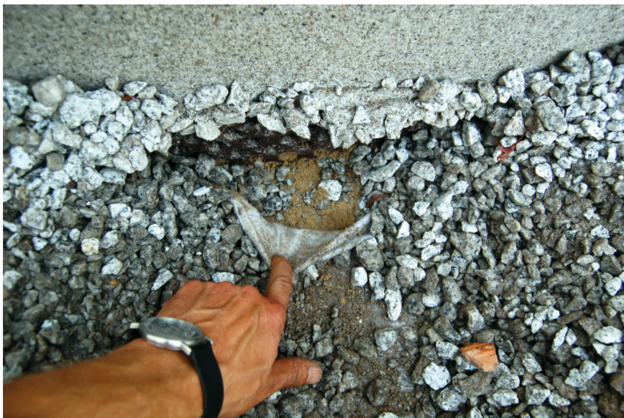
Fot. 8. Nieprawidłowo wykonana opaska żwirowa

podgrzewana i przechodzi w stan gazowy, a następnie jako para wodna jest usuwana, pokonując geowłókniny dyfuzyjne, drenaże, geowłókniny filtracyjne i substraty. Trudniejsze zadanie ma woda zgromadzona w termoizolacji na dachach intensywnych, których miąższość często przekracza metr, na których wykonywane są mocno zagęszczone nawierzchnie jezdne lub inne szczelne elementy. Konieczne staje się zatem poszukiwanie innych dróg ujścia pary wodnej. Jediną możliwą drogą stają się opaski żwirowe wykonywane przy ścianach oraz skrzynkach kontrolnych nad wpustami. Dzięki nim możliwy jest zarówno dostęp tlenu do wewnątrz, jak i dyfuzja pary wodnej na zewnątrz z warstw drenażu. Można to nazwać wyrównywaniem ciśnień w warstwie drenażowej. Prawidłowo wykonana opaska żwirowa dzięki pozbawieniu jej geowłókniny filtracyjnej staje się przedłużeniem drenażu lub – innymi słowy – kominkiem wentylacyjnym. Niestety, jeśli czegoś nie widzimy, to nie wierzymy, dlatego w nieustającym procesie poszukiwania oszczędności bagatelizujemy problem. Często spotykaną na budowach praktyką jest imitacja opaski żwirowej, która wykonywana jest z użyciem grubej warstwy piasku i geowłókniny pod cienką warstwą żwiru (fot. 8). Taka przegroda na pewno nie umożliwi wyrównywania ciśnień, ale z pewnością jest znacznie tańsza.