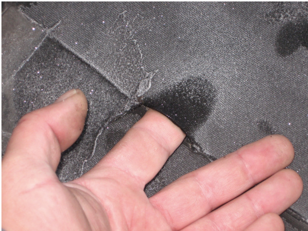
Fot. 2. Rozszczelniony EPDM

wietrze oraz na zawilgoconej lub oblodzonej powierzchni, a także podczas opadów atmosferycznych. Takim zaleceniom trudno jest sprostać w praktyce, ponieważ eliminowałyby to możliwość wykonywania robót w Polsce przez co najmniej cztery miesiące w roku. Niestety nie ma prostej metody sprawdzenia jakości wszystkich parametrów złączy i zgrzewów hydroizolacji. Do rozszczelnienia może dojść w kolejnych latach po oddaniu budynku do użytkowania. Przykładem może być dach z pokryciem z elastomeru EPDM, które się rozszczelniło po pierwszej zimie (fot. 2).