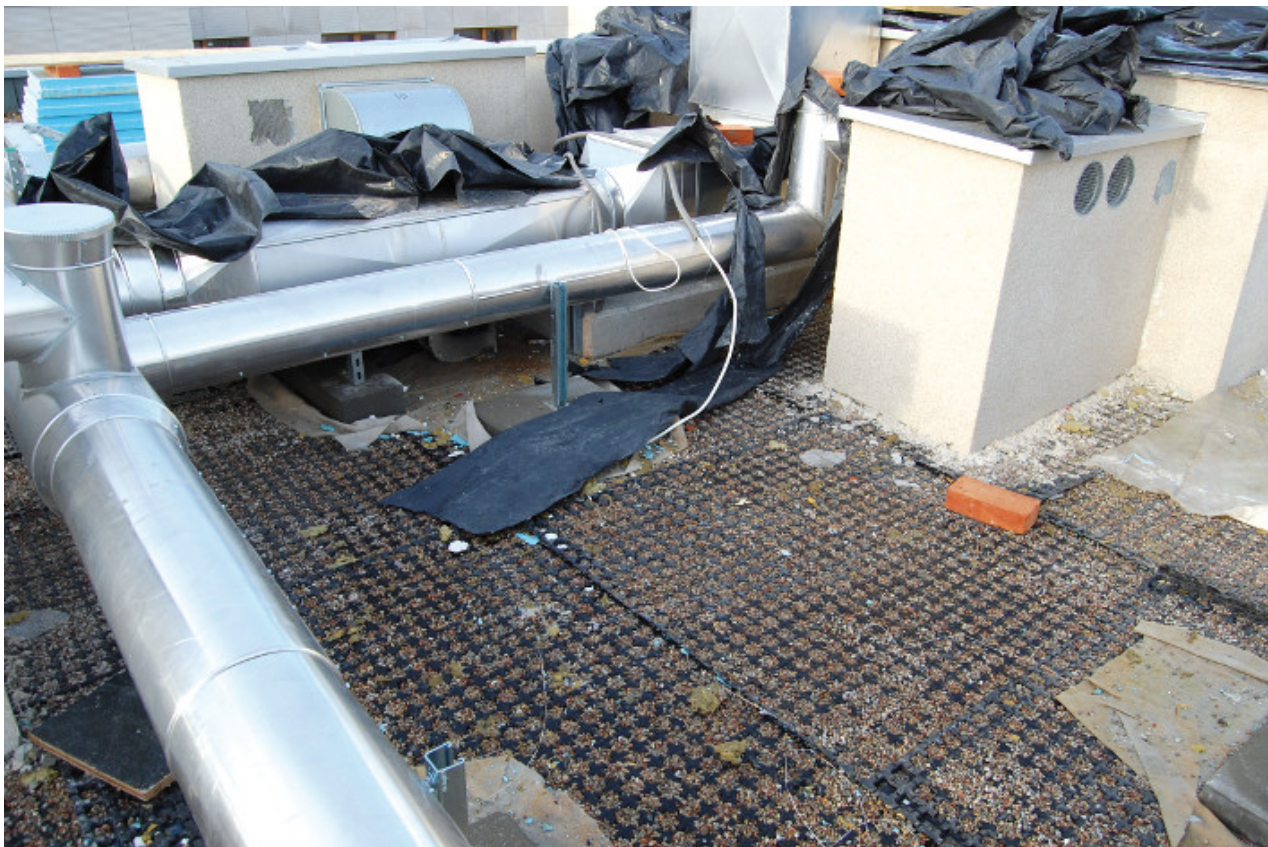
Fot. 4. Wykonanie dachu zielonego oraz innych robót budowlanych i instalacyjnych

Kondensacja pary wodnej w termoizolacji to pseudoprzeciek, który może wystąpić w efekcie nieprawidłowo dobranej lub wykonanej paroizolacji. Zjawisko powstaje na skutek kondensacji pary wodnej, która przenika przez strop, a następnie się gromadzi w termoizolacji, by zimą się skroplić do postaci kondensatu. Kondensatu stale przybywa, ponieważ termoizolacja przykryta jest dyfuzyjnie szczelną hydroizolacją. Jest to zjawisko bardzo rozłożone w czasie i niewidoczne, dlatego często bagatelizowane. Należy zatem pamiętać, że paroizolacja musi się charakteryzować bardzo wysokim oporem dyfuzyjnym, posiadać paroszczelne łączenia, a najlepiej kiedy stanowi również wodoszczelną przegrodę. Wodoszczelna paroizolacja zapewnia dodatkowo funkcję hydroizolacji, która odprowadzi wodę do wpustów w przypadku przecieku. Aby to było możliwe, wpusty dachowe muszą być wyposażone w dwa kołnierze zbierające wodę. Dach zielony nie chroni przed kondensacją pary wodnej, ponieważ nie izoluje przegrody zimą, lecz jedynie zmniejsza liczbę cykli zamarzania.