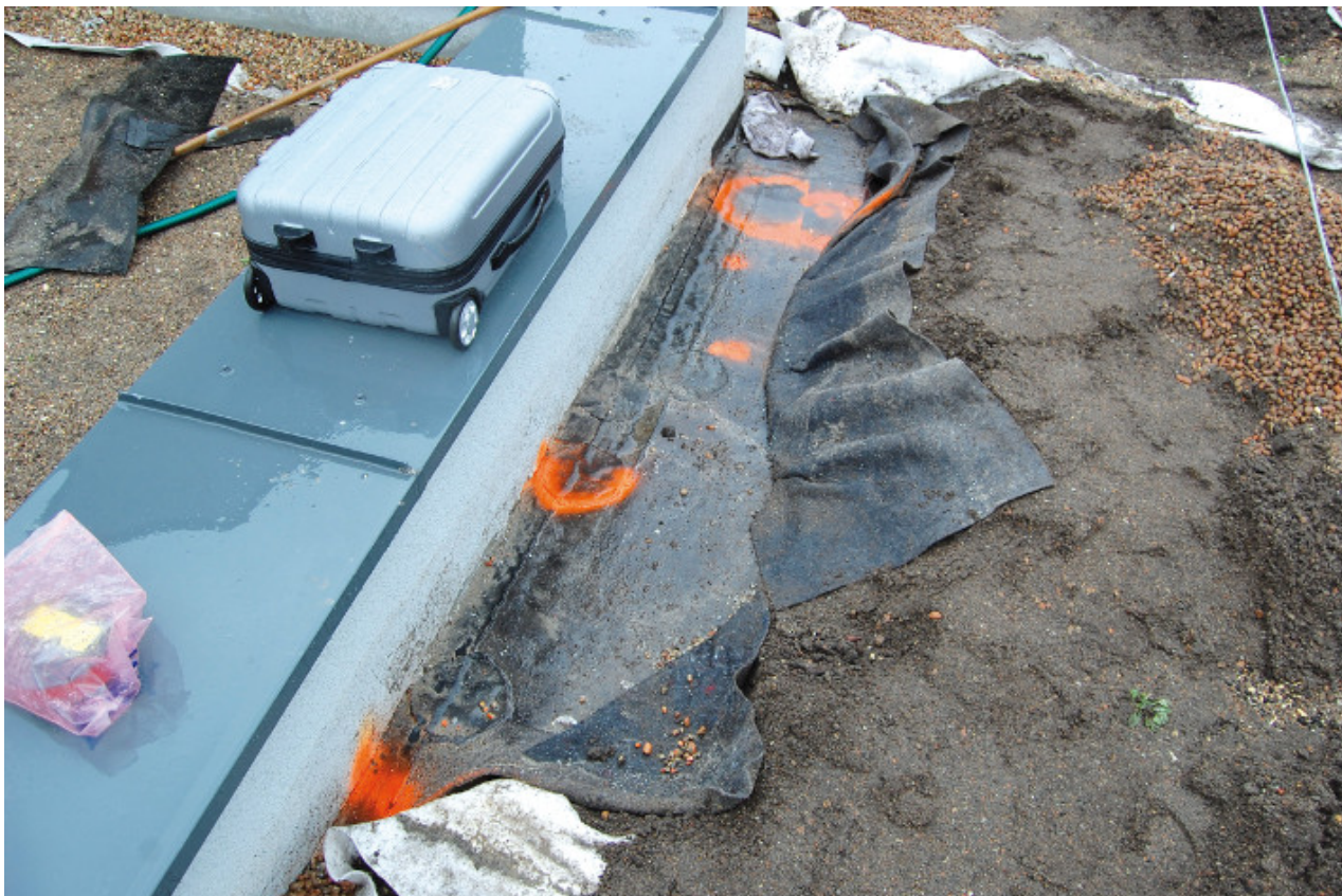
Fot. 3. Poszukiwanie przecieku na dachu zielonym

W katalogu przyczyn przecieków istotną kategorię stanowią uszkodzenia mechaniczne, które mogą powstać w trakcie wykonywania pozostałych robót, w tym warstw dachu zielonego, lub w trakcie eksploatacji obiektu. Dekarz, który wykonał szczelny dach, co potwierdziła próba wodna, teoretycznie może spać spokojnie, ale niestety to tylko marzenie. Po zakończeniu robót dekarских pozostają często do wykonania: ocieplenie i tynk na ścianach cokołowych i kominach, obróbki blacharskie, instalacja anten lub innych urządzeń, instalacja kanałów wentylacyjnych i wreszcie sam dach zielony. Należy bezwzględnie zminimalizować ilość robót prowadzonych po zakończeniu prac dekarских. Często pada pytanie, czy najpierw wykonywać dach zielony czy pozostałe roboty na dachu? Nie ma jednoznacznej odpowiedzi. Z jednej strony dach zielony na pewno zabezpiecza przed uszkodzeniami mechanicznymi, ale on sam może również zostać zniszczony i stratowany przez ekipy budowlane i instalacyjne. W przypadku uszkodzenia hydroizolacji, a nawet jego podejrzenia należy bezwzględnie i bezzwłocznie wezwać dekarza, jednak w praktyce to rzadkość. Uszkodzenie jest bagatelizowane, a pozostawione na pewno będzie skutkowało przeciekiem (fot. 4).