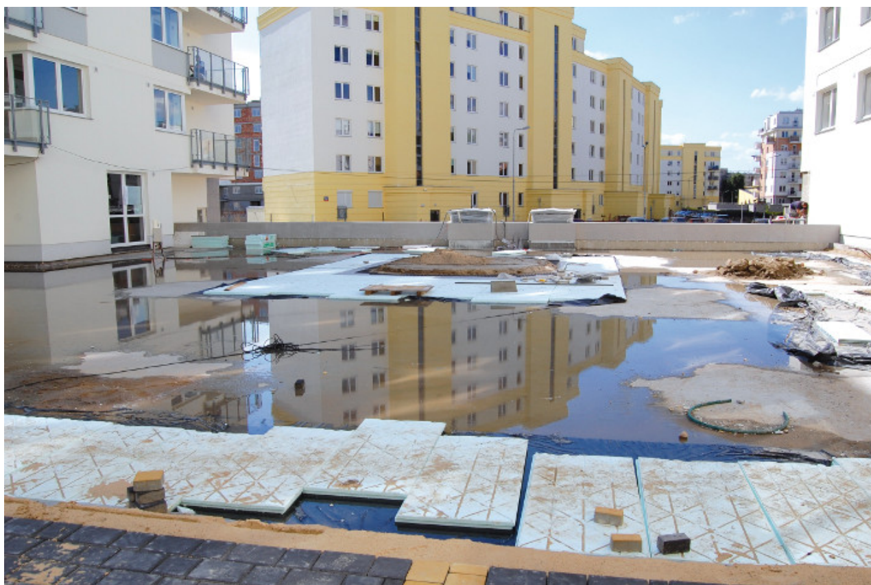
Fot. 5. Przygotowanie do układania termoizolacji

Dachy zielone w Polsce wykonywane są głównie na stropach garaży podziemnych, na których ze względu na obciążenia statyczne i dynamiczne występuje konieczność stosowania dachu odwróconego (strop-hydroizolacja-termoizolacja). Zawilgocenie dachu odwróconego to stan naturalny (hydroizolacja jest zawsze mokra), ponieważ jest to układ przewidziany do przebywania w warunkach stałej wilgotności i obecności wody. Przykładem może być fot. 5, która ilustruje przygotowanie do układania termoizolacji bezpośrednio na mokrej hydroizolacji. A zatem choć niczym niezwykłym jest zawilgocenie termoizolacji, tu też mogą powstać błędy, które doprowadzą do niepożądanych skutków. Mogą wystąpić dwa bardzo groźne zjawiska: drastyczne pogorszenie się współczynnika przenikania ciepła (U) przez przegrodę oraz nieodwracalne procesy gnilne w termoizolacji.