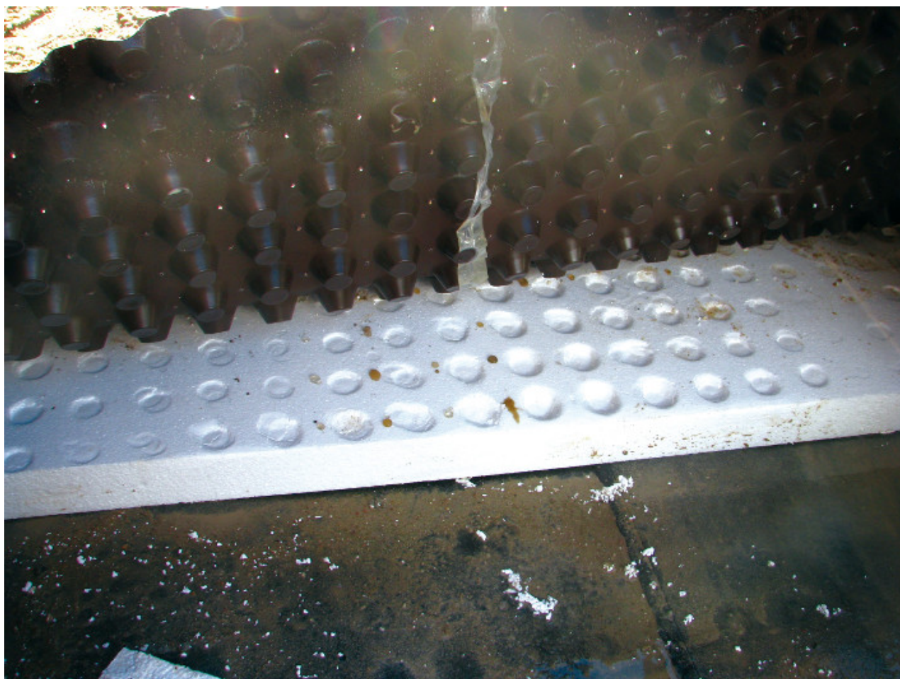
Fot. 7. Termoizolacja uszkodzona przez drenaż

W dachu zielonym warstwę tę oraz geowłókninę nazywamy dyfuzyjną. Drugim zadaniem geowłókniny dyfuzyjnej jest umożliwienie dostępu tlenu do termoizolacji oraz umożliwienie dyfuzji pary wodnej z termoizolacji. Zastanawiając się nad wyborem geowłókniny dyfuzyjnej, musimy się zdać na doświadczenie producentów materiałów do dachu zielonego, ponieważ geowłókniny nie są badane pod kątem współczynnika oporu dyfuzyjnego. Badań się nie prowadzi, ponieważ opór dyfuzyjny geowłókniny nie występuje (jest bliski 1, czyli materiał nie stanowi bariery dyfuzyjnej). Niestety nie każda geowłóknina jest jednakowo dobrym materiałem do zastosowania jako warstwa dyfuzyjna, na przykład geowłókniny igłowane, przebywając w środowisku stale wilgotnym, nasiąkają wodą, przez co ich opór dyfuzyjny rośnie aż do paroszczelności.