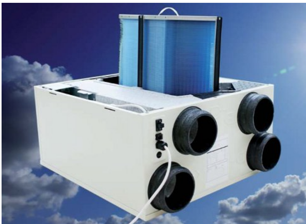
Fot. 2.

Wymienniki ciepła mają różne konstrukcje i w związku z tym różne sprawności odzysku ciepła. Wraz z wentylatorami oraz filtrami i elektroniką sterującą, umieszczone są najczęściej w kompaktowej obudowie (centrali wentylacyjnej). Energooszczędna eksploatacja takiego systemu wiąże się z kilkoma ważnymi warunkami. Pierwszym jest poprawne zaprojektowanie układu rozprowadzenia ciepła po pomieszczeniach, czyli kanałów wentylacyjnych i wchodzącej w jego skład armatury regulacyjnej i eksploatacyjnej. Średnice i wymiary kanałów powinny być dobrane w sposób optymalny pod kątem minimalnych oporów przepływu powietrza, co ma największy wpływ na zużycie energii elektrycznej do napędu wentylatorów. W poprawnie zaprojektowanym układzie, współczynnik zapotrzebowania na energię elektryczną nie powinien być wyższy 0,4-0,5 Wh na 1 m 3 powietrza w wymuszonym obiegu. Sprawność odzysku ciepła w wymienniku powinna uwzględniać możliwość odzysku części ciepła utajonego i nie powinna być niższa niż 88-92%.