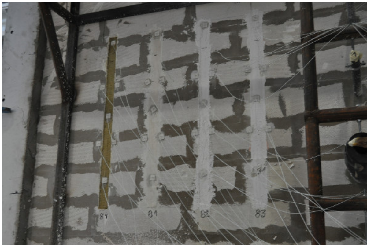
Fot. 3. Widok nienagrzewanej powierzchni elementu próbnego w trakcie badania w zakresie odporności ogniowej (uszczelnienia złączy liniowych w ścianie)

Jedynym sposobem na określenie rzeczywistej klasy odporności ogniowej danego uszczelnienia przejścia lub złącza liniowego jest przeprowadzenie badania zgodnie z odpowiednią normą badawczą PN-EN 1366-3:2010 [15] w przypadku uszczelnień przejść instalacyjnych oraz PN-EN 1366-4+A1:2011 [16]. Normy te określają metodykę badania dla wszystkich opisanych wcześniej rodzajów uszczelnień przejść instalacyjnych oraz złączy liniowych znajdujących się zarówno w stropie, jak i w ścianie. Badanie elementów umieszczonych w stropie przeprowadza się tylko przy oddziaływaniu ognia od spodu stropu, natomiast w przypadku uszczelnień przejść i złączy w ścianie próbkę należy sprawdzić z jednej strony w przypadku rozwiązań symetrycznych oraz z dwóch stron w przypadku rozwiązań niesymetrycznych, chyba że możliwe jest określenie „gorszej” strony przy badaniu, z której element będzie bardziej narażony na oddziaływanie ognia.