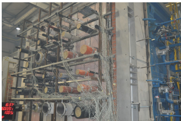
Fot. 1. Widok nienagrzewanej powierzchni elementu próbnego w trakcie badania w zakresie odporności ogniowej (uszczelnienia przejść rur do instalacji ogólnobudowlanych w ścianie)