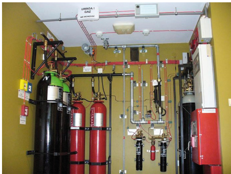
Fot. 5. Przykładowa instalacja SUG gazowych, wykorzystywana do celów szkoleniowych.