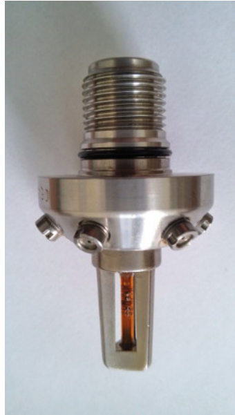
Fot. 2. Głowica mgłowa zamknięta.

urządzenia technologiczne przemysłu drzewnego czy zbiorniki naziemne do cieczy palnych (chłodzenie). Przeciwwskazania do wykorzystywania urządzeń zraszaczowych są zbieżne z tymi określonymi dla urządzeń tryskaczowych.