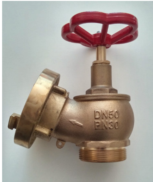
Fot. 4. Zawór hydrantowy.

Hydranty i zawory hydrantowe montowane są na przewodach zasilających instalacji wodociągowej przeciwpożarowej, wykonanych jako piony (nawodnione lub suche) na lub przy klatkach schodowych, bądź jako przewody rozprowadzające w budynkach jednokondygnacyjnych oraz, jeżeli zachodzi taka potrzeba, na każdym poziomie obiektów wielokondygnacyjnych [10].