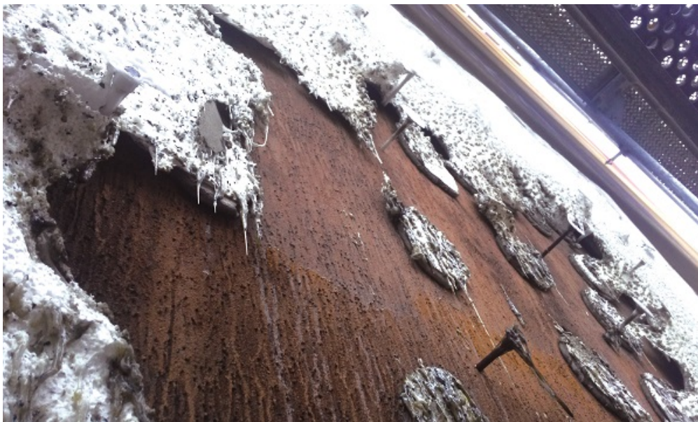
Fot. 5. Uszkodzona

Urządzenia do badań nieniszczących w zakresie oceny stanu ochrony cieplnej budynku, stosowane zarówno dla budynków istniejących np. poddawanych termomodernizacji, jak i nowo realizowanych możemy podzielić na trzy podstawowe grupy. Pierwszą z nich stanowią urządzenia do oceny stanu ochrony cieplnej, w szczególności do badania temperatury powierzchni zewnętrznej i wewnętrznej – pirometry i kamery termowizyjne. Druga grupa to urządzenia do oceny zawilgocenia materiałów budowlanych – wilgotnościomierze stykowe. Do trzeciej grupy możemy zakwalifikować pozostałe urządzenia pomiarowe, w tym do prowadzenia badań towarzyszących, takich jak badania szczelności powietrznej.