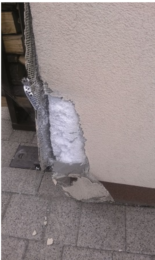
Fot. 6. Uszkodzenia naroża elewacji

powierzchni badanych przegród budowlanych. Prawidłowe wykonanie badań termograficznych i rzetelne opracowanie ich wyników wraz ze szczegółową analizą pozwala na określenie jakości cieplnej przegród badanego budynku oraz zdiagnozowanie anomalii i defektów cieplnych.