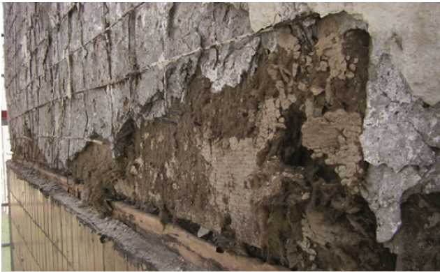
Fot. 2. Odkrywka ściany szczytowej budynku w technologii W-70

zewnątrznych U_{C(max)} = 0,25 \text{ W}/(\text{m}^2\text{K}) . Od 2017 r. nastąpi obniżenie maksymalnej wartości dla ścian do U_{C(max)} = 0,23 \text{ W}/(\text{m}^2\text{K}) , a w 2021 r. do U_{C(max)} = 0,20 \text{ W}/(\text{m}^2\text{K}) [11].