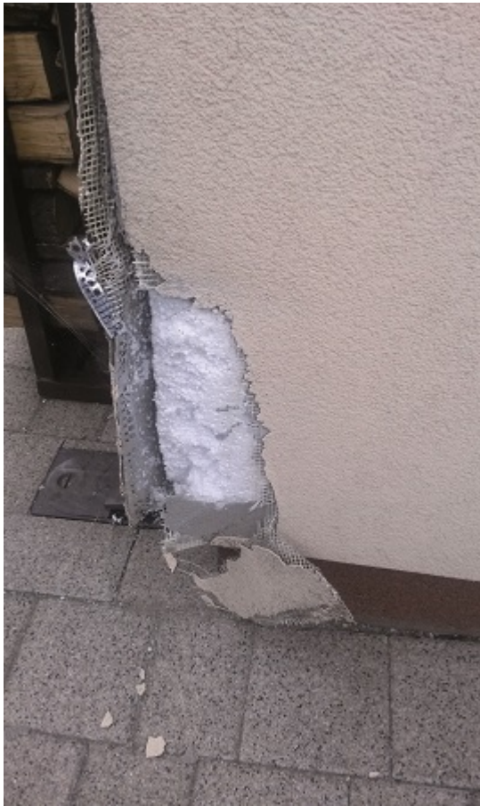
Fot. 6. Uszkodzenia naroża elewacji

powierzchni badanych przegród budowlanych. Prawidłowe wykonanie badań termograficznych i rzetelne opracowanie ich wyników wraz ze szczegółową analizą pozwala na określenie jakości cieplnej przegród badanego budynku oraz zdiagnozowanie anomalii i defektów cieplnych.