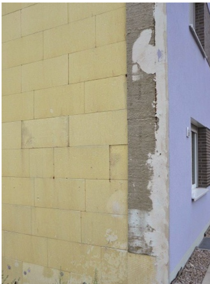
Fot. 1. Renowacja ocieplenia

Pierwsze wytyczne, dotyczące zabezpieczania przed przemarzaniem i przenikaniem wody opadowej przez złącza ścian wykonywanych z wielkowymiarowych prefabrykatów trójwarstwowych i ścian szczytowych z cegły żerańskiej, zostały opracowane w 1972 r. w Instytucie Techniki Budowlanej w Warszawie [1]. W tamtym czasie jednym z pierwszych materiałów stosowanych do ociepleń ścian budynków był styropian o grubości nieprzekraczającej 3 cm. Zabezpieczany on był tynkiem cementowo-wapiennym i układany na siatce z prętów zbrojeniowych.