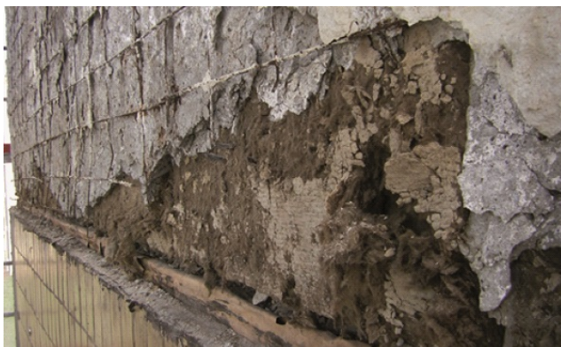
Fot. 2. Odkrywka ściany szczytowej budynku w technologii W-70

zewnątrznych U_{C(max)} = 0,25 \text{ W}/(\text{m}^2\text{K}) . Od 2017 r. nastąpi obniżenie maksymalnej wartości dla ścian do U_{C(max)} = 0,23 \text{ W}/(\text{m}^2\text{K}) , a w 2021 r. do U_{C(max)} = 0,20 \text{ W}/(\text{m}^2\text{K}) [11].