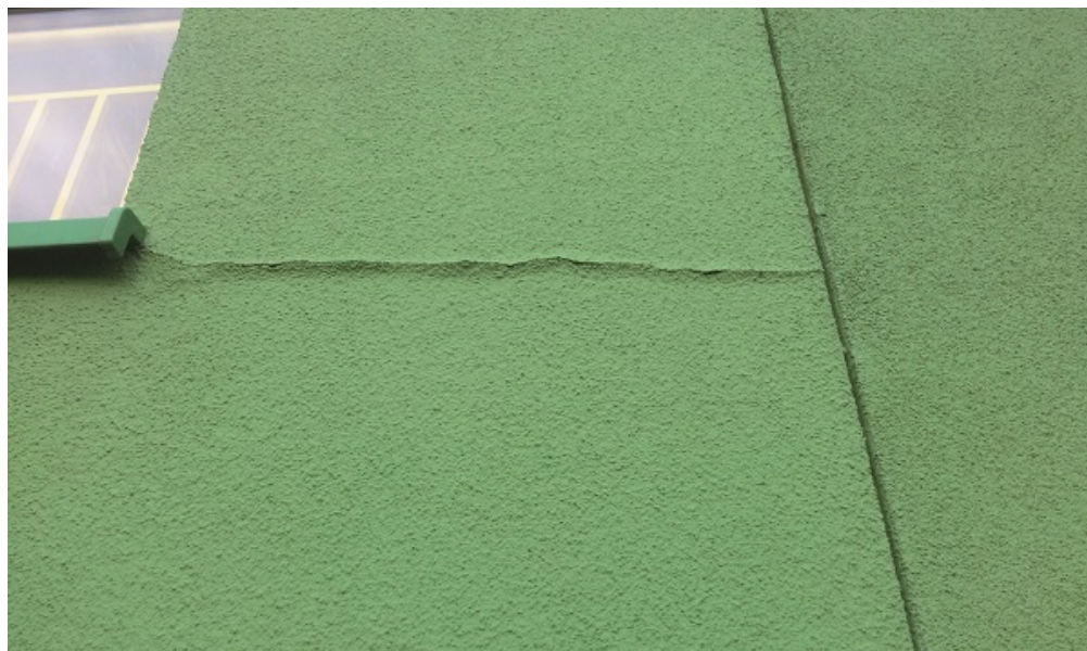
Fot. 4. Rysy na ścianie

Jednym z pierwszych kroków jest przeprowadzenie analizy archiwalnej dokumentacji projektowej. Powinna być ona przeprowadzona zarówno dla projektu budowlanego, jaki i projektu wykonawczego, o ile taki powstał. Dodatkowo ważne jest sprawdzenie ewentualnych projektów zamiennych oraz dokumentacji powykonawczej. Celem analizy dokumentacji projektowej jest weryfikacja poprawności przyjętych rozwiązań materiałowo-konstrukcyjnych. Dzięki temu będzie możliwe wyspecyfikowanie błędów, które powstały już na etapie dokumentacji technicznej. Mogą one być związane z nieprawidłowo wykonanymi obliczeniami lub wadliwie zrealizowanymi rozwiązaniami elementów budowlanych. Szczegółowa analiza obliczeniowa umożliwi przeprowadzenie oceny rozwiązań projektowych. Jednym z przykładów takich działań jest obliczenie rozkładu temperatury i określenie wartości liniowego współczynnika przenikania ciepła mostka termicznego w oparciu o np. dwuwymiarowy model przegrody. Na rys. 1 pokazano przykład tego typu modelowania przegrody w obrębie złącza poziomego ściany wielkopłytkowej.