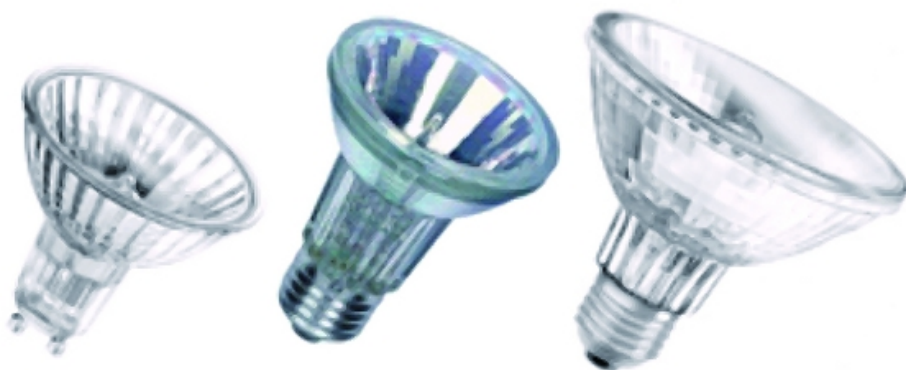
Fot. 5. Typowe kształty żarówek z reflektorem typu PAR16, PAR20, PAR30

Żarówki halogenowe zasilane napięciem sieciowym oferowane są również w wersji żarówek reflektorowych. Do typowych rozwiązań tego typu źródeł można zaliczyć reflektorowe żarówki halogenowe z odbłyśnikiem szklanym typu PAR (fot. 5). Żarówki z odbłyśnikiem MR16 o średnicy zewnętrznej 51 mm, swoim kształtem przypominają żarówki reflektorowe (MR16) zasilane napięciem obniżonym 12 V. Reflektorowe żarówki halogenowe wyposażone są w trzonki kołkowe typu GZ10 i GU10 lub trzonek gwintowy E14 w przypadku żarówek PAR również w trzonki E27.