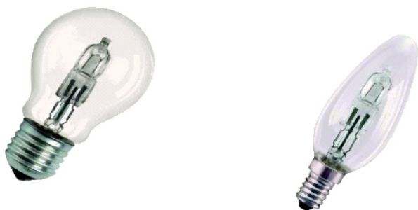
Fot. 4. Kształt żarówek halogenowych: klasyczny, świecowy

Żarówki halogenowe zasilane napięciem sieciowym przypominają swoim kształtem żarówki głównego szeregu i żarówki reflektorowe. Wyposażone są w trzonek E27 i dzięki temu stanowią dla nich alternatywne źródło światła. Żarówki konwencjonalne mogą być zastępowane tego typu źródłem światła, dzięki czemu uzyskuje się: zwiększoną skuteczność świetlną i średnio dwukrotnie dłuższą trwałość. Przykładowe kształty żarówek halogenowych z bańką klasyczną przedstawione są na fot. 4.