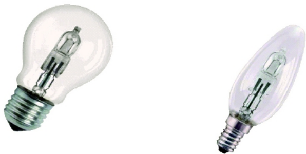
Fot. 4. Kształt żarówek halogenowych: klasyczny, świecowy

Żarówki halogenowe zasilane napięciem sieciowym przypominają swoim kształtem żarówki głównego szeregu i żarówki reflektorowe. Wyposażone są w trzonek E27 i dzięki temu stanowią dla nich alternatywne źródło światła. Żarówki konwencjonalne mogą być zastępowane tego typu źródłem światła, dzięki czemu uzyskuje się: zwiększoną skuteczność świetlną i średnio dwukrotnie dłuższą trwałość. Przykładowe kształty żarówek halogenowych z bańką klasyczną przedstawione są na fot. 4.