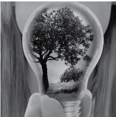
Fot. 1. gilles lougassi – Fotolia.com

Z tak szerokiej oferty źródeł światła, można wybrać rozwiązanie, które zapewni oświetlenie w każdym wybranym obszarze oraz spełni stawiane wymagania. Jest wiele firm produkcyjnych, jednak nie wszyscy dostawcy energooszczędnych źródeł światła oferują produkty najwyższej jakości.