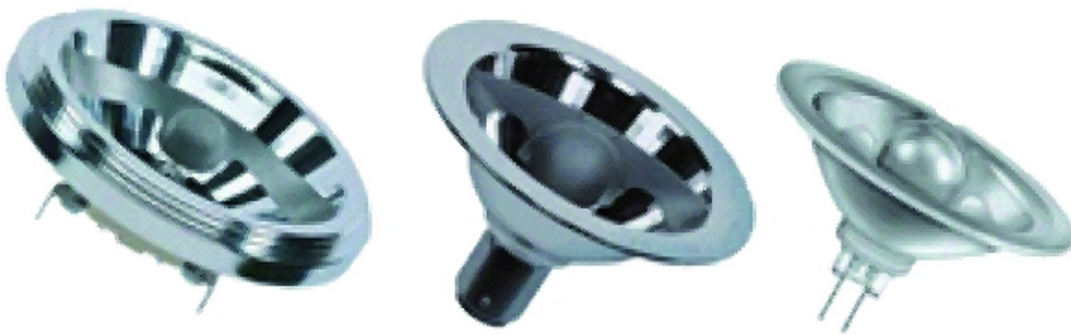
Fot. 7. Przykłady żarówek halogenowych z reflektorem aluminiowym

Żarówki z reflektorem aluminiowym wykonane są z odbłyśnikiem paraboloidalnym z aluminium. Ich charakterystyczną cechą są wąskie kąty rozsyłu światła: 4°, 8° i 24° (fot. 7). Przeznaczone są do oświetlenia akcentującego.