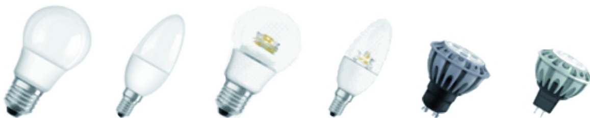
Fot. 2. Przykładowe konstrukcje lamp LED zasilanych napięciem 230 V i 12 V

Lampy LED ze względu na swoją wysoką skuteczność świetlną (średnio pięciokrotnie wyższą od tradycyjnych żarówek) i długą trwałość (średnia trwałość waha się w granicach od 25 000 do 50 000 h) w odpowiednim zastosowaniu mogą stanowić alternatywę dla żarówek tradycyjnych, halogenowych zasilanych napięciem sieciowym i obniżonym 12 V Ich stosowanie przynosi duże oszczędności w kosztach eksploatacji oświetlenia, głównie dzięki wyższej efektywności i dłuższej trwałości od tradycyjnych żarówek.