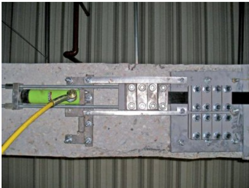
Fot. 4. Przykład realizacji sprężania taśmami z włókien węglowych