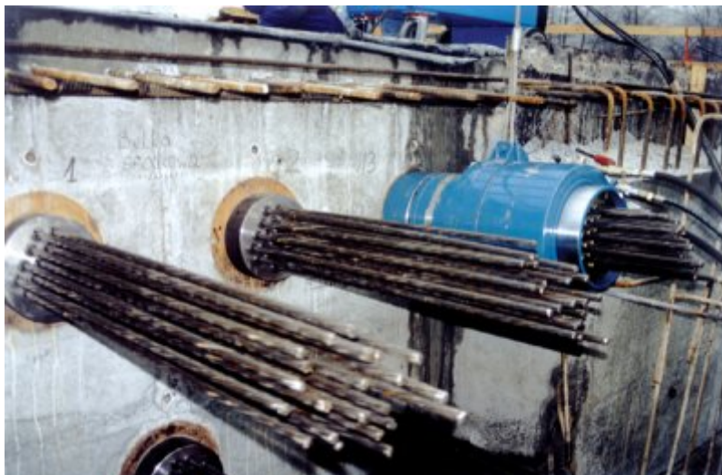
Fot. 2. Zakotwienia czynne kabli na czole elementu sprężonego