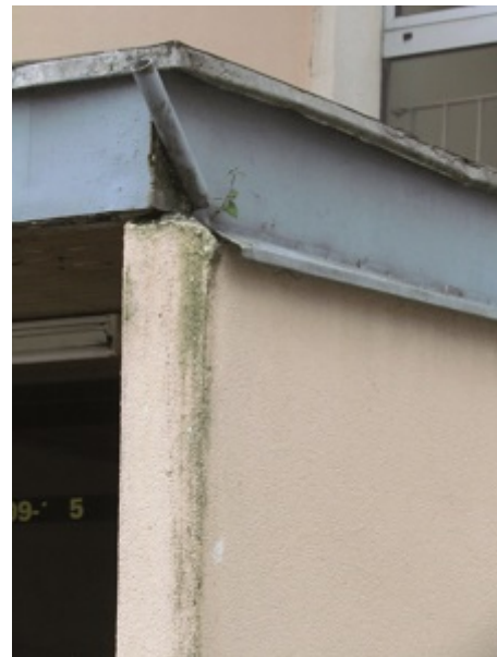
Glony w miejscach utrzymywania się wilgoci od przecieków z nieprawidłowo wykonanych obróbek blacharskich

Jeżeli doszło do rozwoju glonów, konieczne będzie wykonanie zabiegów dezynfekcyjnych i zabezpieczających tynk przed ponownym porastaniem. Do odkażania stosuje się preparaty (środki biobójcze) przeznaczone odpowiednio do zwalczania glonów, grzybów czy pleśni. Zabieg odkażania to nic innego jak czyszczenie na mokro odpowiednio twardą szczotką, ale nie uszkadzającą tynku. Preparaty należy stosować ściśle według zaleceń producenta, zachowując należyte środki ostrożności. Oczyszczone i