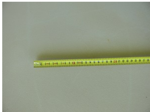
Mikrorysy na tynku mineralnym, tradycyjnym