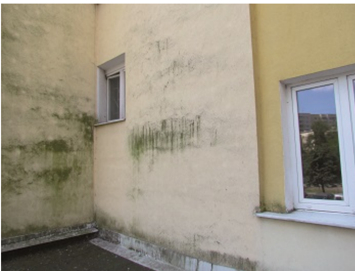
Charakterystyczne porastanie glonami ściany o ograniczonym dostępie słońca i bliskim sąsiedztwie drzew

Charakterystyczne zazielenienie tynku wskazuje na rozwój glonów. Glony najczęściej pojawiają się na ścianach o ograniczonej operacji słonecznej (strona północna), usytuowanych w sąsiedztwie drzew i krzewów oraz na ścianach obiektów znajdujących się na terenach o podwyższonej wilgotności np. nadmorskich, w okolicach zbiorników wodnych. Wszędzie tam, gdzie powłoka długo zachowuje wilgoć z opadów, kondensacji lub miejscowych przecieków, np. od złych obróbek blacharskich, nieszczelnych instalacji, braku lub nieodpowiedniej izolacji. Na szybkość porostania glonami wpływa również kurz, brud i zawartość związków organicznych w wyprawie tynkarskiej, które stanowią źródło pożywki dla zarodników. Glony podczas wegetacji wydzielają związki organiczne, które mogą wpływać niszcząco na strukturę tynku, np. poszerzając istniejące wcześniej spękania. Stanowią zagrożenie dla stanu technicznego elewacji, ale nie są szkodliwe dla zdrowia mieszkańców.