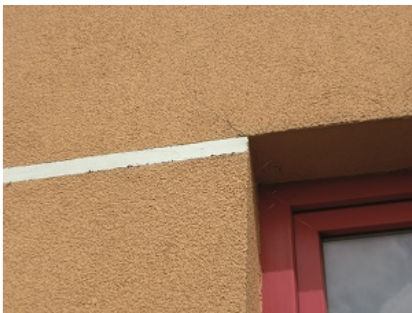
Pęknięcie tynku w narożniku otworu okiennego, przy którym nie wykonano dodatkowego diagonalnego zbrojenia siatką

W przypadku wyrobów mineralnych konieczne trzeba je chronić przed działaniem wilgoci, a dyspersyjnych - nie wystawiać na działanie mrozu czy wysokich temperatur. Nawet jeżeli skawalenia zostaną usunięte, a grudki roztarte, zaprawa mineralna nie osiągnie wymaganej wytrzymałości - tynk będzie się kruszył i słabo przylegał do podłoża. Podobny skutek przyniesie zastosowanie przemrożonej masy dyspersyjnej.