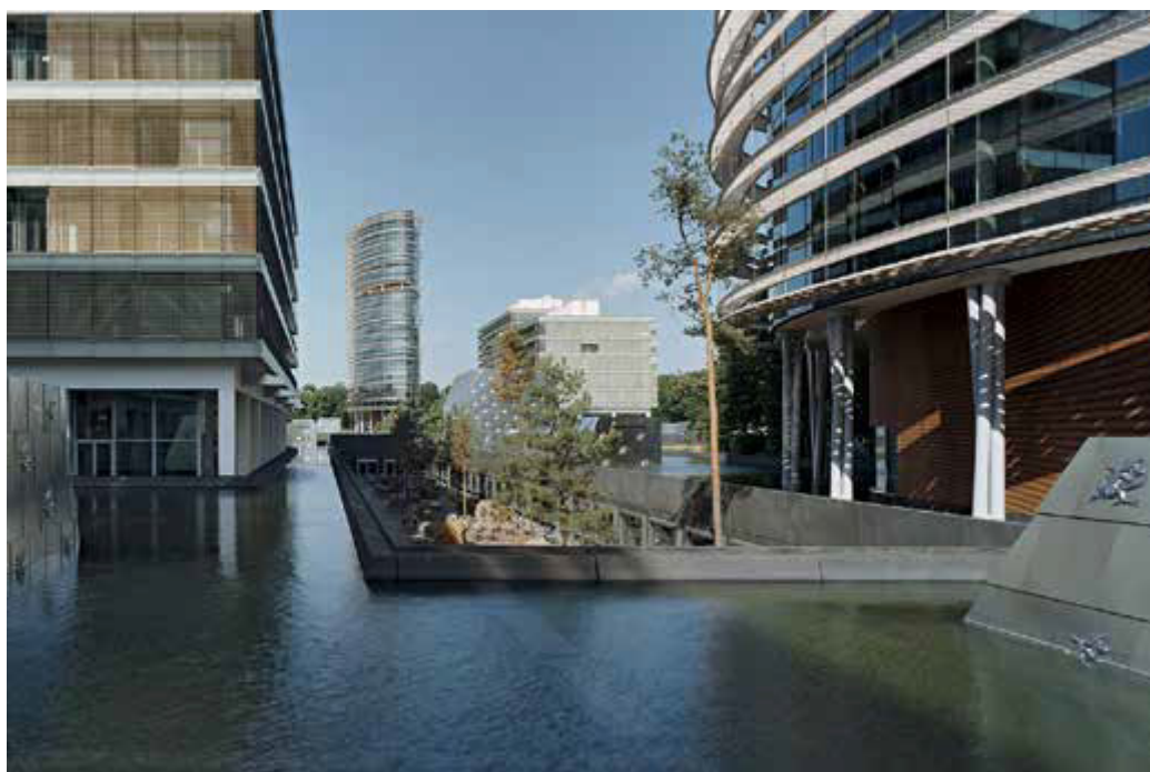
Fot. 4. Dach błękitny w Apeldoorn, Holandia (fot. Neutelings Riedijk Architects WBC) [4]

Wykonanie dachu błękitnego wydaje się banalnie proste, ale należy przemyśleć kilka istotnych kwestii, np. rodzaj zastosowanych materiałów hydroizolacyjnych pod kątem ich odporności na wieloletnie cykliczne zwilżanie/moknięcie i wysychanie oraz ich odporność na zwiększone oddziaływanie promieniowania UV w strefie wilgotnej. W tym rozwiązaniu sprawdzą się basenowe membrany PCV lub EPDM, niemniej należy uzyskać od producenta materiału stosowną gwarancję. Dach należy przygotować także na inne niż zwykle wyzwania, np. oddziaływanie wiatru, a zatem powstające na dachu fale oraz wypiętrzenia wynikające z cyklicznego zamarzania zgromadzonej wody. Do tego dochodzą kwestie trywialnej eksploatacji dachu, to jest remonty i naprawy lub czyszczenie. Bezwzględnie takie dachy należy dzielić na sekcje, umożliwiające szybkie, czasowe osuszenie danego zbiornika. Oczywiście warto wyposażyć je w system monitoringu szczelności w warstwie termoizolacji, który zawniesu ostrzeże o powstałym przecieku.