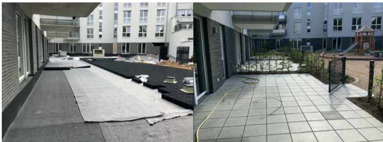
Fot. 1. Dach retencyjny w Kolonii, Niemcy [3]

Podsumowując, dach zielony o zwiększonej zdolności retencyjnej można wykonać na prawie każdym dachu. Na fot. 1 można zobaczyć rozwiązania techniczne z realizacji dachu retencyjnego w Kolonii w Niemczech (budowa w 2020 r.) [3].