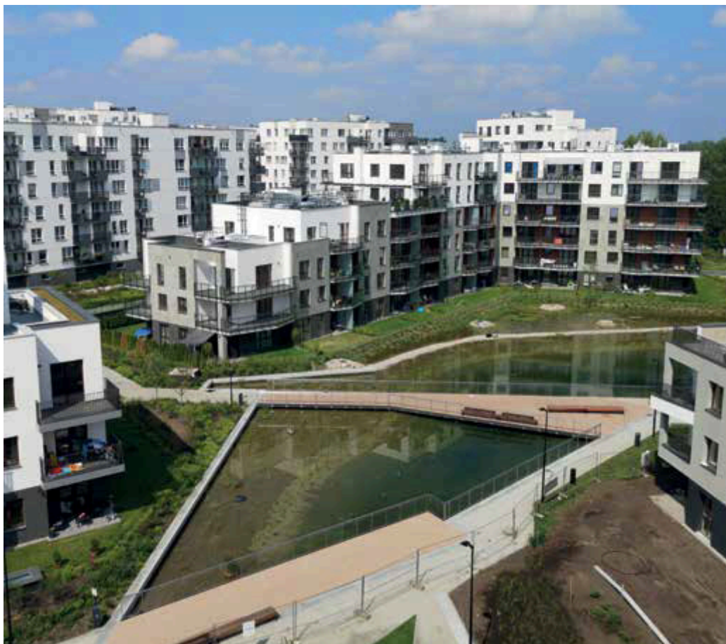
Fot. 3. Zbiornik retencyjny, Central Park Ursynów przy ul. Kłobuckiej w Warszawie

Dachy można z powodzeniem wykorzystać do zasilania otwartych zbiorników retencyjnych na terenie inwestycji. Przykładem może być osiedle Central Park Ursynów przy ulicy Kłobuckiej w Warszawie (fot. 3), gdzie wszystkie dachy wykonano jako ekstensywne (ok. 20 000 m 2 ), z których woda gromadzona jest w dwóch zbiornikach usytuowanych na terenie osiedla.