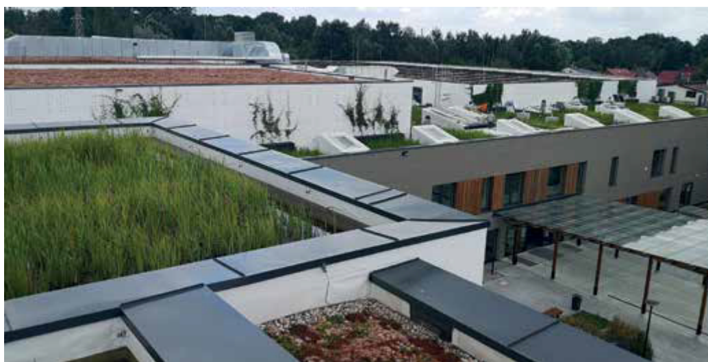
Fot. 2. Dach multifunkcyjny Centrum Edukacyjno-Rekreacyjnego w Markach

W wodzie zgromadzonej na dachu, na specjalnie przygotowanym podłożu, jest roślinność bagienna. Rozwiązanie to powstało z uwagi na brak możliwości odprowadzenia z dachu wody opadowej do kanalizacji ogólnospławnej i braku systemu kanalizacji deszczowej na tym obszarze. Wykorzystano zjawisko ewapotranspiracji – łączącej ewaporację, czyli parowanie powierzchniowe, z transpiracją, czyli parowaniem przez liście roślin.