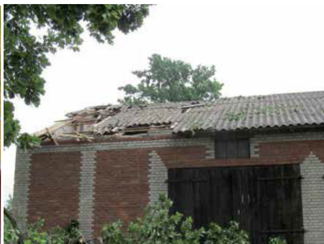
Fot. 6. Ten dach ma uszkodzenia bardzo charakterystyczne dla oddziaływań silnych wiatrów wiejących w kierunku równoległym do kalenicy. Przy takim ustawieniu budynku największe siły ssące występują nad ścianą szczytową - od strony nawietrznej.