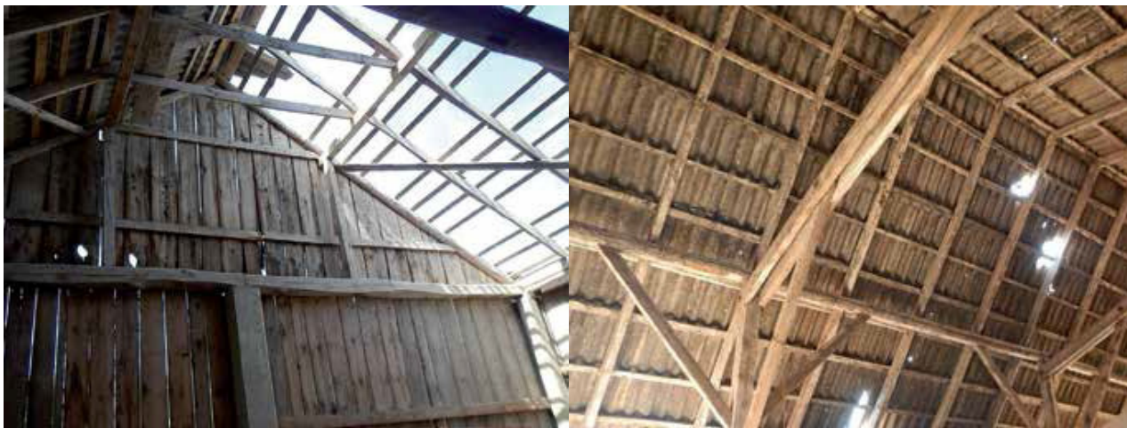
Fot. 7. Dachy nad wiatami, stodołami i magazynami z otwartymi wrotami nazywane są dachami otwartymi. Wiatr działa na nie odwrotnie i wywiera ciśnienie od środka wpadając przez wrota lub konstrukcję bez litych ścian.