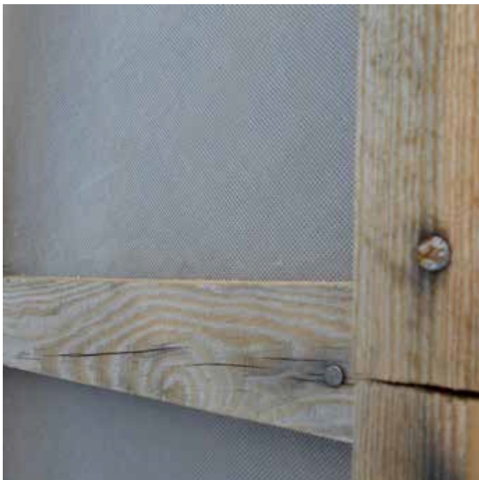
Fot. 4. Zdjęcie zostało wykonane w sierpniu 2018 roku. Tak mocuje się ruszt pod pokrycia dachów pochyłych (tu położono blachodachówkę) od ponad dwudziestu lat, ponieważ większość dekarzy uczy się od siebie na budowach (nic nigdy nie czytając).

Oglądając każdego roku obrazy zerwanych dachów łatwo można zauważyć wciąż powtarzające się przypadki zrywania blach razem z łątami i kontrłatami (fot. 2 i 3). Takie skutki spowodowane są wadliwym doбором i mocowaniem kontrłat do więźby dachowej i łąt do kontrłat. Powszechnym błędem jest montowanie na dachach pochyłych kontrłat o wymiarach 50x25 mm (fot. 4). Są one szczególnie często stosowane pod pokryciami z blach profilowanych z kilku powodów. Jednym z nich jest postawa producentów tych pokryć. W wielu zaleceniach pokazywane są wyłącznie cienkie listewki przybijane zbyt cienkimi gwoździkami do więźby. Ten błąd, bez zastanowienia, powtarzają dekarze na dachach, co nie powinno nikogo dziwić, ponieważ formalnie nie wymaga się od nich posiadania jakiegokolwiek wiedzy teoretycznej. Dekarzem zostaje się w momencie zgłoszenia działalności gospodarczej polegającej na prowadzeniu usług dekarских, bez żadnych wymagań. Tak cienkie listewki, montowane szybko i niestarannie (fot. 4) nie mogą stanowić pośrednich elementów montażowych odpornych na zrywanie w czasie wichur lub huraganów.