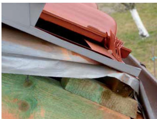
Fot. 5. Wadliwie wykonany okap dachu pokrytego dachówką. Nie ma wlotu do szczeliny utworzonej przez kontrłaty. Nie ma spływu skroplin. Tak samo wykonuje się ruszt pod blachy profilowane z tą różnicą, że pod blachami są cieńsze kontrłaty.

Warto jeszcze dodać, że dodatkowym zagrożeniem jest wzrost popularności dachów o niskim kącie nachylenia (od 20^\circ do 30^\circ ). Gdy o sposobie mocowania pokryć na takich dachach będą decydowali przeciętni dekarze, to wzrośnie liczba zrywanych dachów, ponieważ nie wiedzą oni o tym, że znaczący wpływ na wielkość obciążeń spowodowanych działaniem wiatru ma kąt nachylenia połączy dachowej. Czym jest on mniejszy tym, siły ssące wiatru są większe. Przekonało się o tym wielu właścicieli dachów płaskich. Na dachach pochyłych nisko nachylonych (od 5^\circ do 30^\circ ) występują najsilniejsze obciążenia wiatrowe (rys. 1). Z tego powodu, w tym zakresie nachylenia, waga pokrycia ma największe znaczenie - im pokrycie jest cięższe, tym bezpieczniejsze, a lekkie pokrycia wadliwie zamocowane (lub użyta jest zbyt cienka kontrłata) mogą być łatwo zrywane.