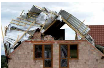
Fot. 2. Blachodachówka została poderwana na krawędzi szczytowej dachu. Dalsze uszkodzenia powstały z powodu zerwania połączenia między łątami i kontrłatami lub kontrłatami i więźbą. Dowodzi to zastosowania zbyt słabych gwoździ. Farmery natomiast utrzymały łąty.