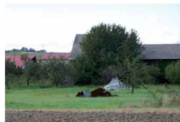
Fot. 3. Te fragmenty dachu zostały przeniesione na odległość 250 m. Zdjęcie zostało zrobione z krawędzi budynku, z którego „sfrunął” ten dach. Tutaj też widać łąty i kontrłaty przeniesione na „skrzydło” blach. Ten efekt zgadza się z działaniem pokazanym na schemacie z rys. 2.

Natomiast nowe dachy, które w tych miejscowościach były pokryte wyłącznie blachodachówkami zostały zerwane (fot. 2 i 3). Warto zastanowić się, dlaczego tak się dzieje. Otóż specyfika działania gwałtownych wiatrów polega na powstawaniu wirów powietrza o bardzo dużej energii chwilowej i dużej prędkości. Takie wiatry powodują przy przekraczaniu jakichkolwiek krawędzi i barier bardzo duże siły ssące (rys. 1 i 2). Te same siły ssące, powstające pod wpływem ruchu powietrza podnoszą najcięższe samoloty. Jeżeli tak silny wiatr spotka na swojej drodze dach z ciężkim pokryciem, to duża część jego energii zostanie zużyta na jego podniesienie. Jeżeli dodatkowo pokrycie to składa się z wielu łatwo podwiewanych (dla wiatru) elementów, to pozbywa się on energii wyładowując ją na każdym z nich. Tak właśnie dzieje się z dachówkami.