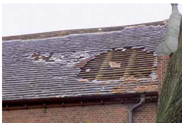
Fot. 1. Stary dach pokryty dachówką karpiówką (jedną z cięższych pokryć) został uszkodzony przez silny wiatr wiejący skośnie od strony szczytu z attyka. Dachówki poderwały siły ssące, które są najsilniejsze tuż za przeszkodami (attyka i kalenica).

Na załączonych zdjęciach (fot. 1, 2 i 3) widać skutki działania takich ekstremalnych wiatrów. Warto zauważyć, że nie wszystkie dachy są tak łatwo uszkodzane. Okazuje się, że najstarsze z nich pokryte starymi, ręcznie robionymi dachówkami cementowymi lub fabrycznymi ceramicznymi (fot. 1), zachowały swoje drewniane (nienowe) konstrukcje. Dachówki zostały zerwane i porzucane wokół budynków. Niektóre z nich przeżyły to bez uszczerbku i mogły powrócić na łaty.